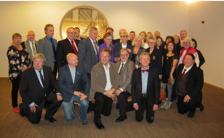
Eurooppalaisen Suomen jäsenmatka Brysseliin, 2016.