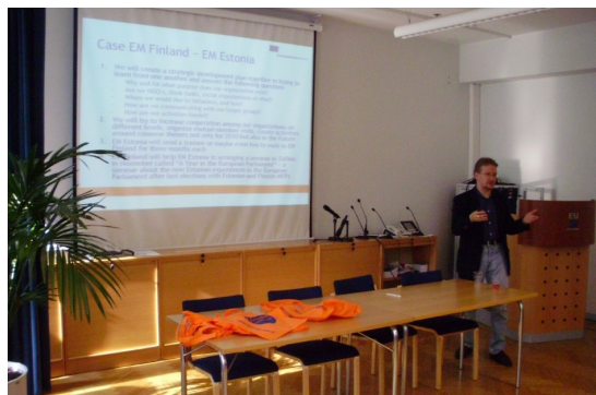
Tukholman eurooppaliike vierailulla 2010.

Naapurimaista aktiivisimmaksi kehuaan Norjan pro Eurooppaliikettä, joka Euroopan unionin jäsenyyden puuttumisesta huolimatta on Euroopan mittakaavassa harvinaisen aktiivinen. Yhdistys on myös erityisen toimintakykyinen, koska Norjan valtio tukee sekä EU:ta puoltavia ja vastustavia järjestöjä samalla summalla vuosittain.