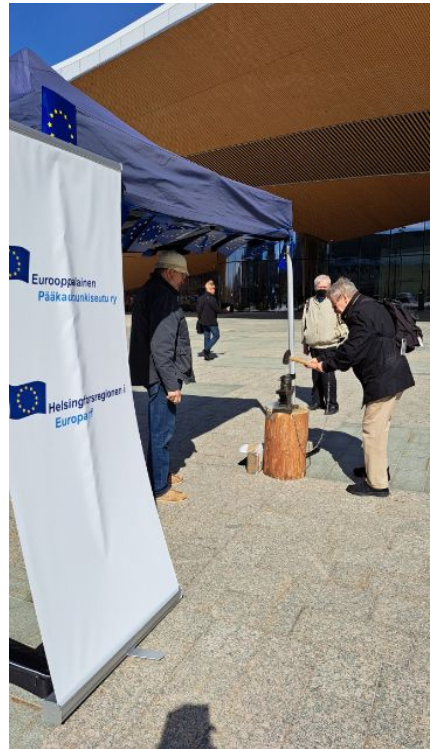
Eurooppa-päivä ja kolikonlyöntiä Oodin edustalla, 2023.