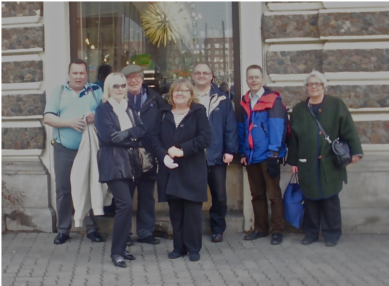
Yhdistyksen jäsenmatka Varsovaan, 2012.

Yhdistyksen jäseniä kutsuttiin myös Puolan suurlähetystöön vuoden 2010 puheenjohtajuuskaudella, ja seuraavana vuonna yhdistys matkusti jäsenmatkalle Varsovaan Puolan Eurooppaliikkeen vieraaksi.