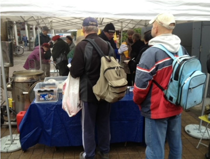
Hernekeittojakelua Kontulan toimintapäivässä 2012.

Vuonna 2012 syntyi uusi perinne, kun yhdistys toteutti ensimmäisen kerran ajatuksen eurooppalaisesta toimintapäivästä. Toimintapäivä järjestettiin Kontulassa. Silloinen hallituslainen kuvasi, että toimintapäivällä haluttiin osoittaa, että kyseessä ei ole salonkijärjestö. Toimintapäivässä jaettiin hernekeittoa yhdessä Helsingin työttömät ry:n kanssa yli 300 hengelle. Paikalla keskustelemassa oli yhdistyksen aktiivien ohella myös europarlamentaarikko Mitro Repo.